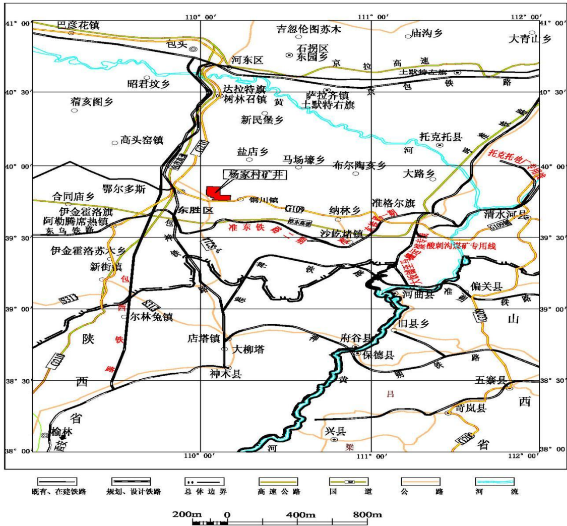
图 1-5-1 交通位置图